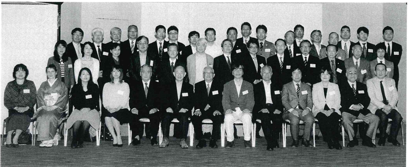
第5回 四極青雲会総会 平成27年4月25日(九峰会との合同懇親会)

今日まで同窓会の発展に尽くされた歴代会長の熱意と情熱とあわせて多くの諸先輩方のご尽力に心より感謝の一言である。歴代会長は、野内四郎七氏(高商1回)、中寫(柳)要次郎氏(高商1回)、佐伯鶴太郎氏(高商1回)、河野不二人氏(高商7回)、高山善吉氏(高商10回)、桑原豊氏(高商20回)田中康生氏(経専