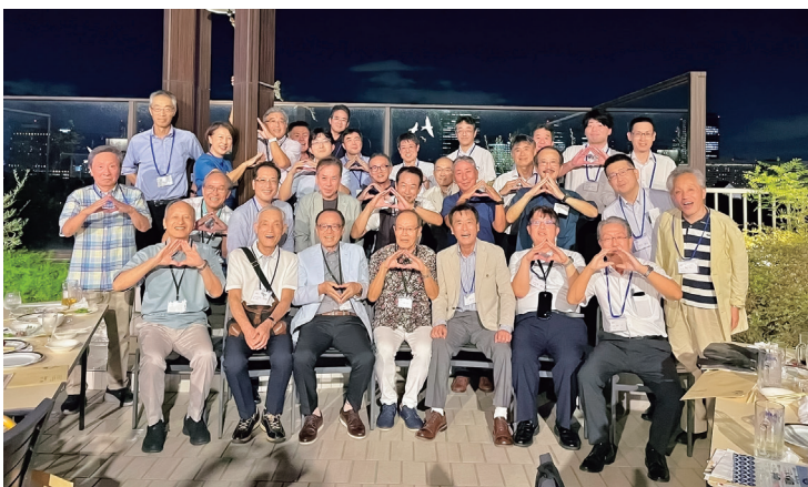
大阪城を望むピアガーデンで開催

この夏、試験勉強に向けて頑張った人、筋トレに励んだ人、阪神タイガースの応援に情熱を注いだ人等、様々な話で盛り上がりしました。最後は、和田会長からもご自身が活動されている天文クラブと星の話を熱く楽しく語っていただき、気付けばあっという間に時間が過ぎ、大盛り上がりの中に第2回関西