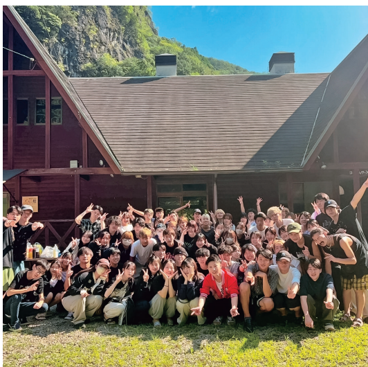
70名が支え合って、キャンプは大成功

入念な準備を重ね、本番を見据えた確かなスケジュール管理を行いました。そして本番では自ら率先して行動し、参加者を引っ張っていく姿勢を見せました。また、人を楽しませたい、喜ばせたいという強い思いを持ち、全員が笑顔になれるよう工夫を随所に凝らしました。こうしたエンタメ力と主体性が相まって、参加者からも「来てよかった」「また参加したい」といった声が多く寄せられました。