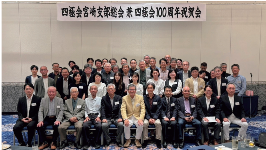
カジュアルな服装で総勢50名が参加 (ニューウェルシティ宮崎で)

祝賀会では、事務局より差し入れていただいた清酒「四極」に舌鼓を打ちながら、1年ぶりの再会を喜び合い、仲間との思い出話に花が咲きました。 また、100周年を記念して抽選会を実施。新役員や来賓の方々に番号札を引いていたいただき、当選者が景品を受け取るというシンプルな形式ながら、大変な盛り上がりを見せました。