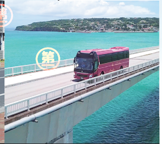
沖縄地区(バス事業)