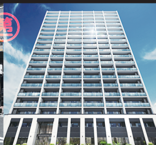
グランドパレス黒崎マークスタワー