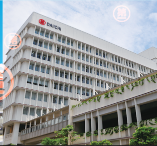
那覇市カフーナ旭橋C街区