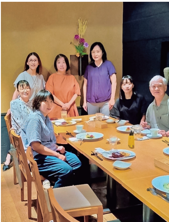
和田会長（右端）も出席しました

令和7年9月13日（土）、残暑厳しく、[GRILL & BAR DINING 燦大丸梅田店（14階）]に、女性会員6名が集まり、第