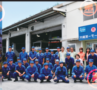
沖縄第一モータース