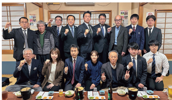
新役員も決まって、ガッツポーズの会員

四極会竹田支部設立総会を令和7年11月14日(金) 竹田市内の「ひょうたん」で開催しました。竹田支部は、約10年前から