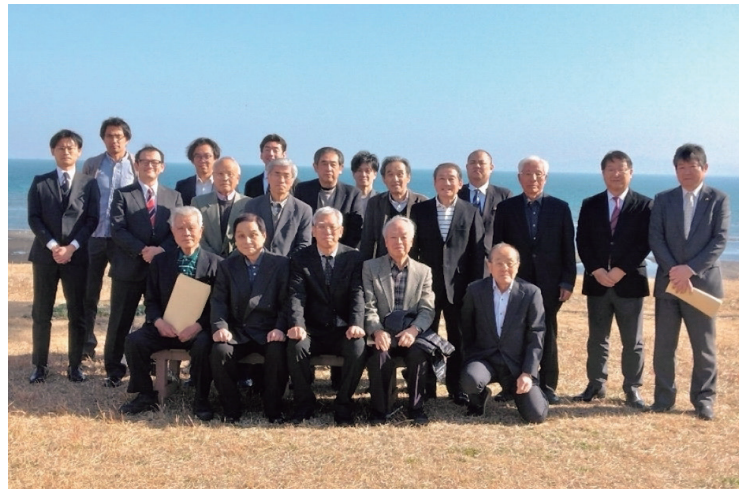
いやあー、うらやましい限りの所ですね

発声ではじまりました。今回は、だれでも気軽に参加しやすいようにといいことで、ビュッフェ形式を採用しました。久しぶりの顔ぶれの参加