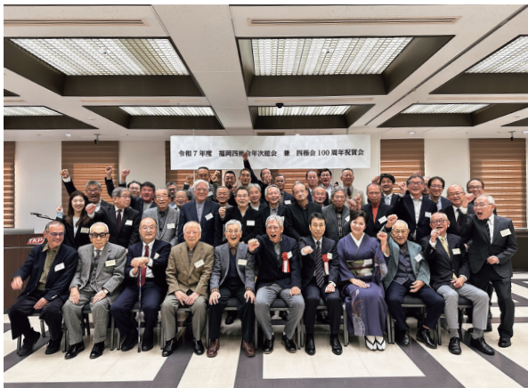
101年目の新しい一歩を踏み出した福岡四極会

令和7年11月23日(日)スカイホール天神において「令和7年度福岡四極会年次総会兼四極会100周年祝賀会」を開催し