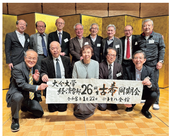
2年後に50周年記念同窓会を開くことを決定

令和8年1月22日(木)にキハ会館「ローズの間」で「大学26回生古希記念同期会」を開催しました。