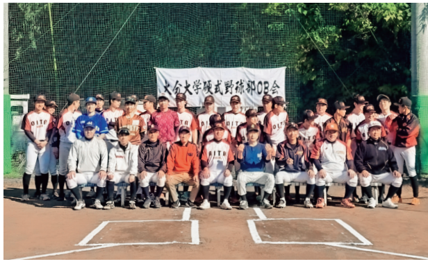
新しい取り組みに39名が集まる

次の100年に繋がる新しい取り組みとして、現役部員の負担を減らす為に「OB戦」と「現役部員激励会」両方を1日のみ