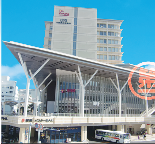
那覇バスターミナル