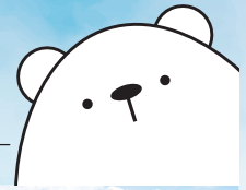
第一交通産業 公式キャラクター 「タクマ」

私たちは、現在、旅客運送事業と不動産関連事業を柱に、自動車関連事業やインドを始めとする国際事業など、幅広いフィールドで事業を展開しています。それらに通底するのは、人と時代を見つめ「いま地域社会に求められているものは何か」を見極め、事業というカタチに具現化する視点です。