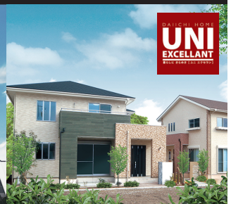
戸建住宅(第一ホーム)