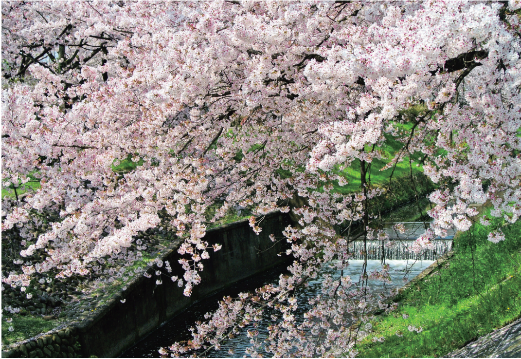
唐沢堤の桜 石橋 泉三 (大13・千葉県船橋市)