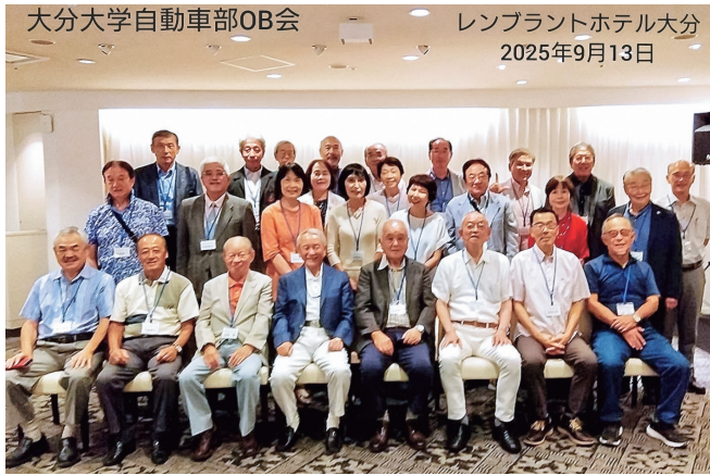
東京や大阪から29名が参加 (大分市のレムブランドホテルで)