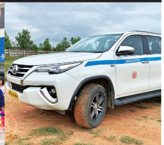
インドでの国際事業