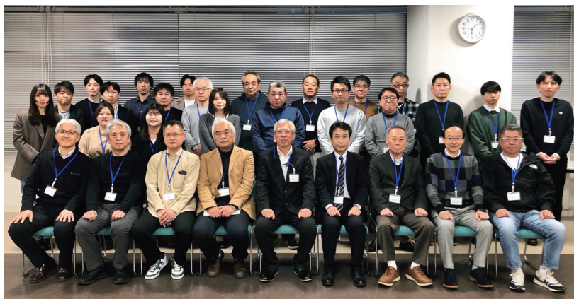
リラックスした雰囲気参加者(花邨で)

は経済学部の近況として、新設から丸2年となる総合経済学部の各コースの状況や今年度の就職状況について、また新しく設立された地域経済社会教育開発センターの活動についてお話しいただきました。