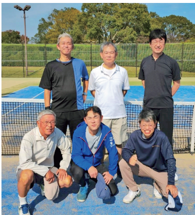
テニスで健康そのものです

第2回三経テニスOB戦を2025年11月8日(土)宗像ユリックステニスコートで開催しました。長崎大瓊林会(7名、山口大(鳳陽会)6名、大分大(四極会)6名参加)レダブルス3チームで対戦、結果各大学とも1勝1敗でした。ゲーム得失では大分がトップでしたが、大会は親善が目的ということで引