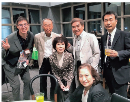
渡邊副学長や高見学部長も！