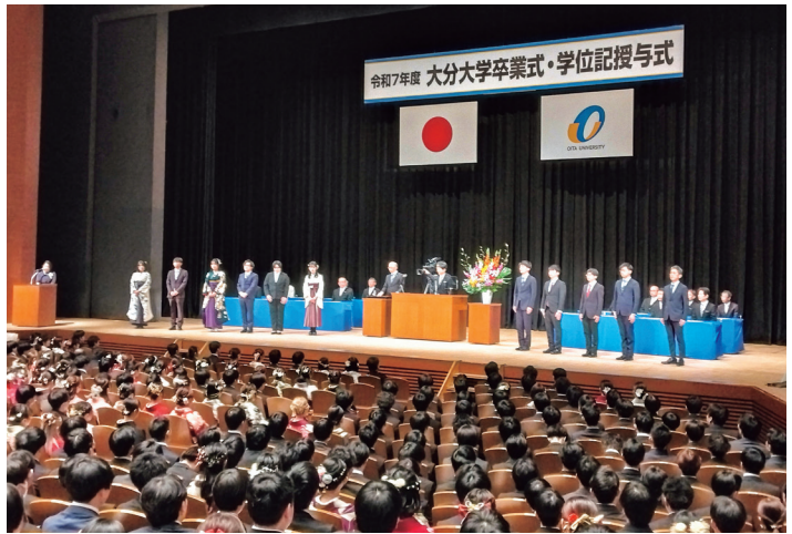
学位記授与式で表彰される学生が壇上に並ぶ

令和7年度卒業式・学位記授与式が令和8年3月25日(水)「iichikologranシアタ」で開催されました。学部卒業生(学士)は1,044名、修士・博士課程が206名。内経済学部は学部卒業生が273名、修士・博士課程が3名でした。