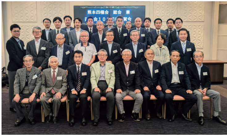
さすが熊本。皆さん、キリッとしています (鶴屋百貨店カーネーションサロンで)

令和7年10月18日(土) 18時より鶴屋百貨店カーネーションサロンにて、令和7年度熊本四極会総会兼四極会100周年祝賀会を開催致しました。当日は、