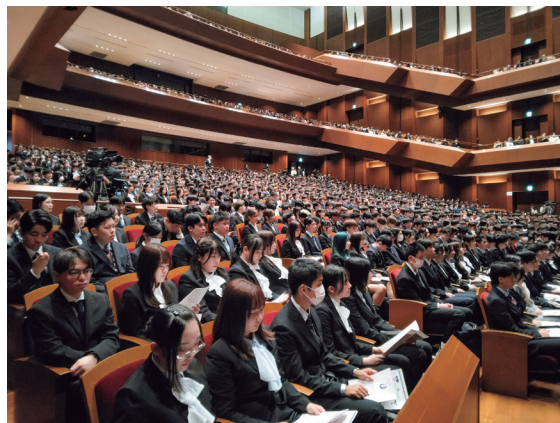
経済学部には299名が入学しました

令和8年4月4日(土)「iichiko グランシアタ」で令和8年度大分大学入学式が開催された。今年はいち、184名の学部生(内経済学部287名)、264名の大学院生(内経済学部12名)が新たに大分大学の一員となった。