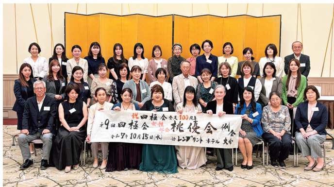
9回目を迎え37名が出席 (レンブラントホテル大分で)

告や、歩こう会・囲碁会・若手会・ワイン会・ゴルフ会など各活動の報告も続き、会場は終始活気に満ちていました。