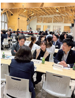
イキイキと質問する学生

令和7年11月7日(金)18時30分より、大分大学且野原キャンパス学生食堂「B・Forêt」で、第11回「学生と先輩との交流会」を開催しました。当日は学生30名弱・先輩は17の企業・団体から38名が参加して熱心に意見交換が行われました。 特筆すべき点は、 1 昨年から他学部への参加をOKとしましたので、理工学部