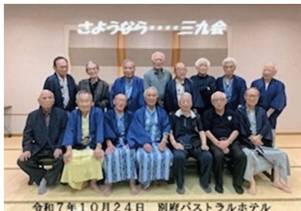
別府のパストラルホテルに15名が集まる