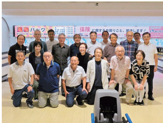
大分市のOBSボウルに19名が集結

(軌跡)昭和40年にはTVで大分大学のボウリング競技が放映されていて、九州共立大学が慶應義塾大学等を寄せ付けず連覇し