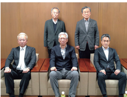
大分合同新聞社の役員応接室で