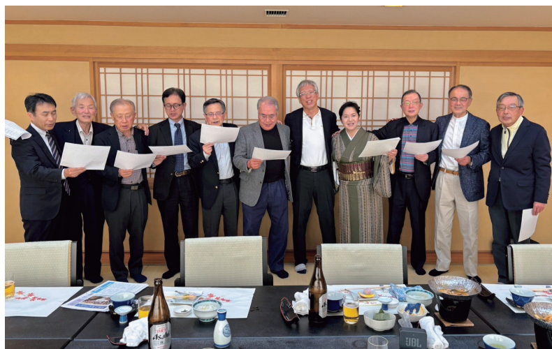
全員で肩を組んで校歌や寮歌を斉唱

令和7年11月29日（土）、佐賀市内の四季彩ホテル「千代田館」で佐賀支部総会および四極会発足100周年祝賀会が行われた。日程の都合や病気で欠席者が少なく、昨年度に比べ参加人数が少なく、総勢11名で開催された。佐賀支部には約30名の登録会員がいる。