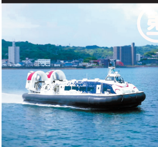
海上アクセス整備事業