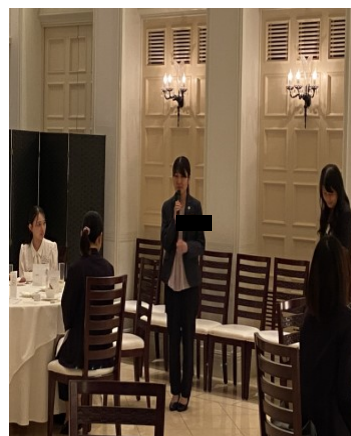
初参加大70回生Hさん ご挨拶