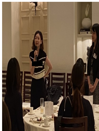
60回代初参加代表大 63回生Kさんご挨拶