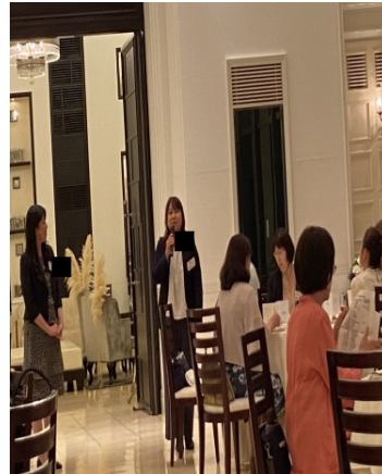
初参加大35回生Nさん ご挨拶