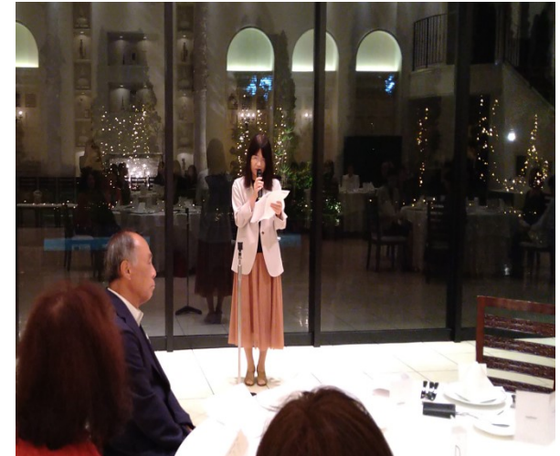
四極会大分支部支部長(大34回)開会ご挨拶