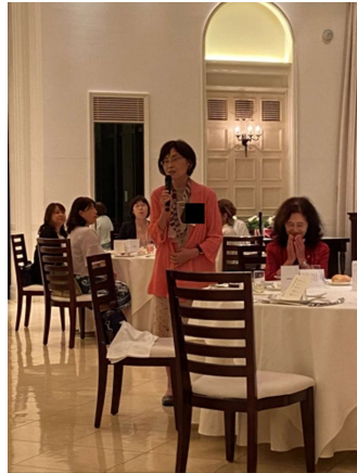
唯一の20回代大25回 生Aさん初参加ご挨拶