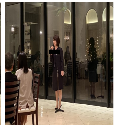
閉会の挨拶大45回生S さん