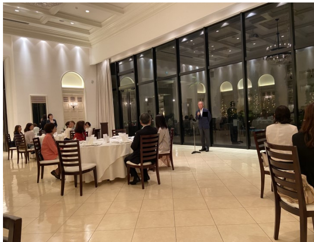
桃優会監事(大26回)挨拶