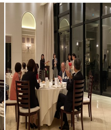
抽選会当選のお一人 大60回生さん