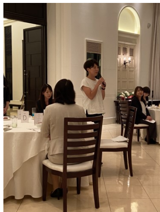
50回代初参加代表大 57回生Sさんご挨拶