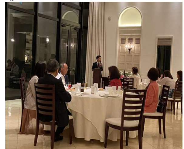
マリーゴールド迎賓館によるテーブルマナー1シーン