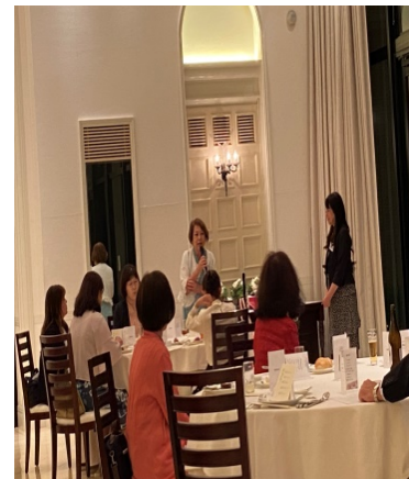
熊本支部より参加大37 回生さんご挨拶