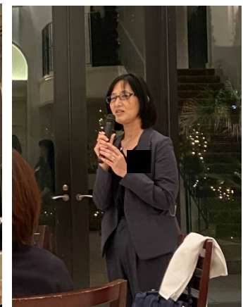
40回代初参加代表大 43回生Fさんご挨拶