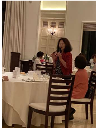
唯一の10回代大15回 生Mさん初参加ご挨拶

令和5年9月22日に大分「マリーゴールド迎賓館」にて「第7回桃優会」が開催されました。（掲載されなかった初参加の方、誌面の関係でご容赦下さい。）