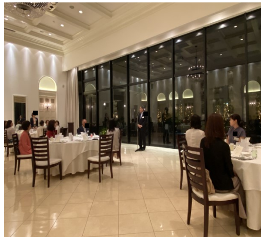
桃優会相談役(大29回)挨拶及び乾杯の音頭